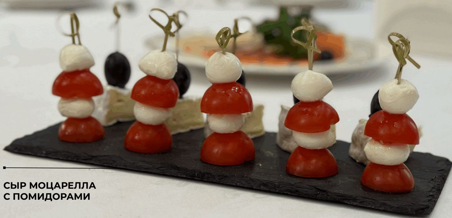
СЫР МОЦАРЕЛЛА С ПОМИДОРАМИ