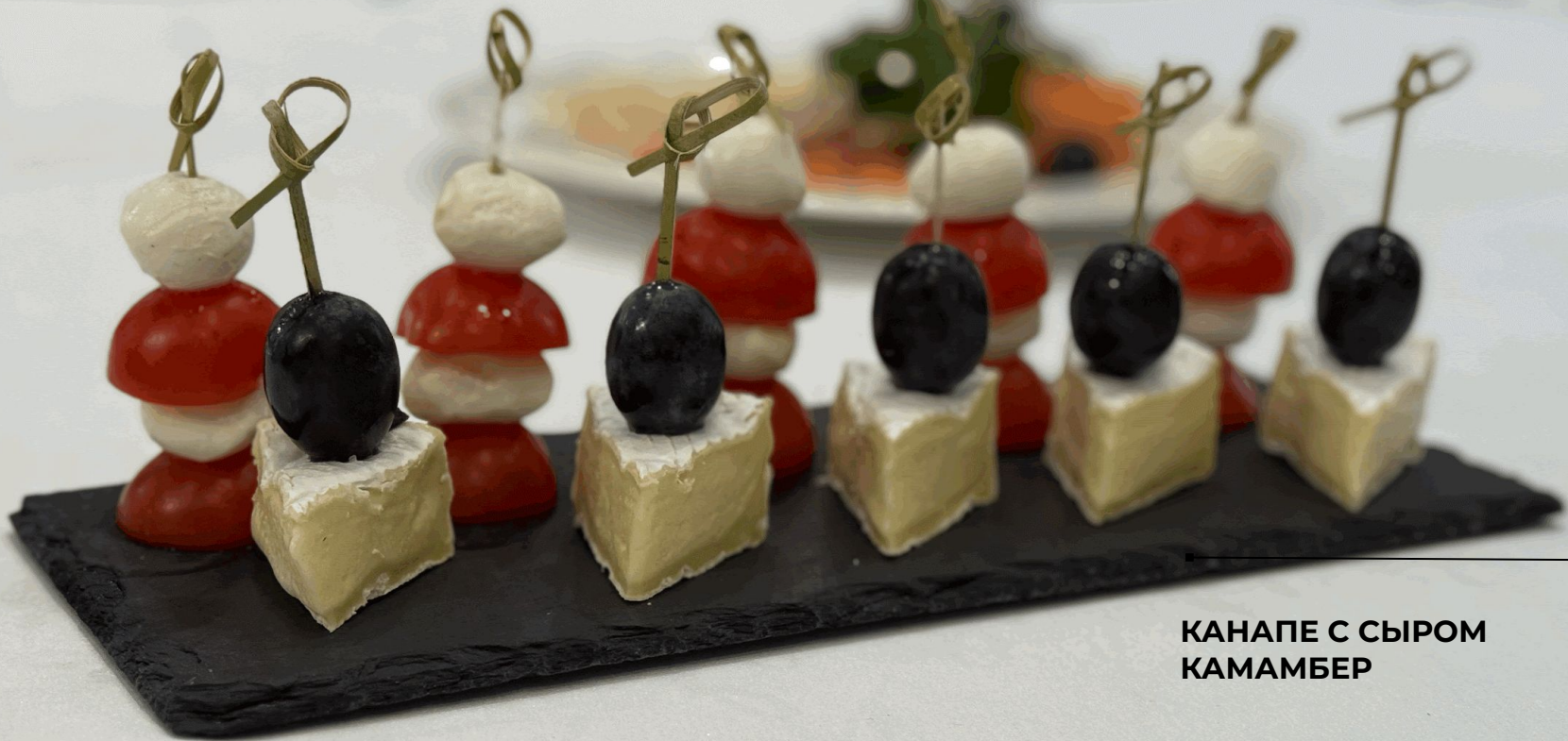
КАНАПЕ С СЫРОМ КАМАМБЕР