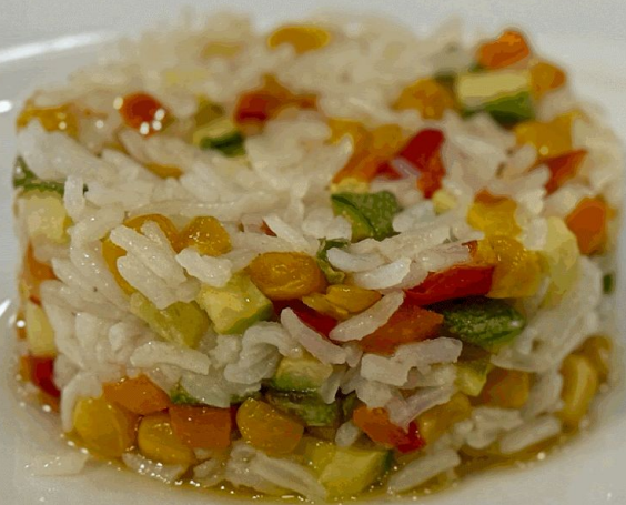
РИС С ОВОЩАМИ