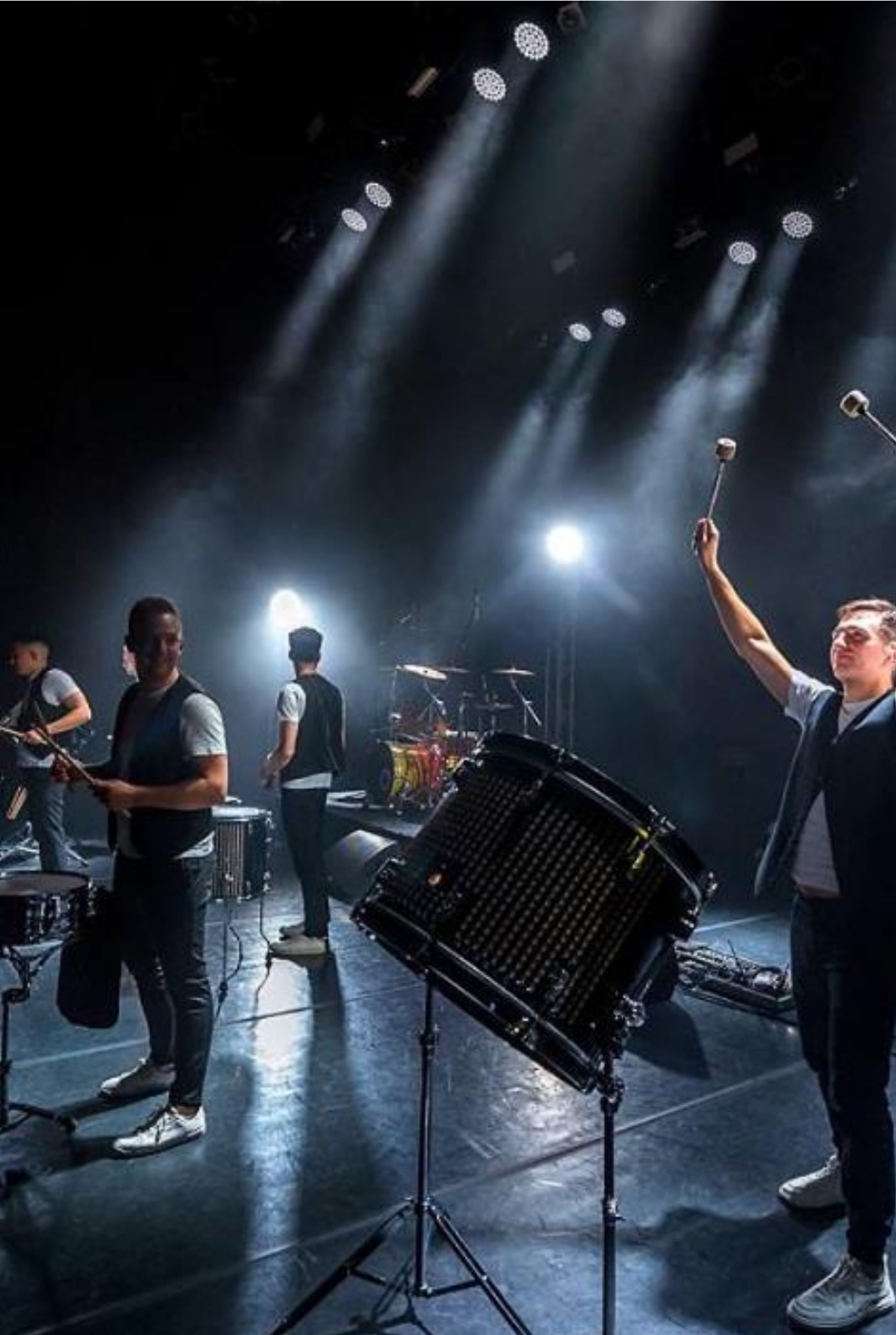
Шоу барабанщиков «Big Drumma Show» создаст атмосферу турбулентности