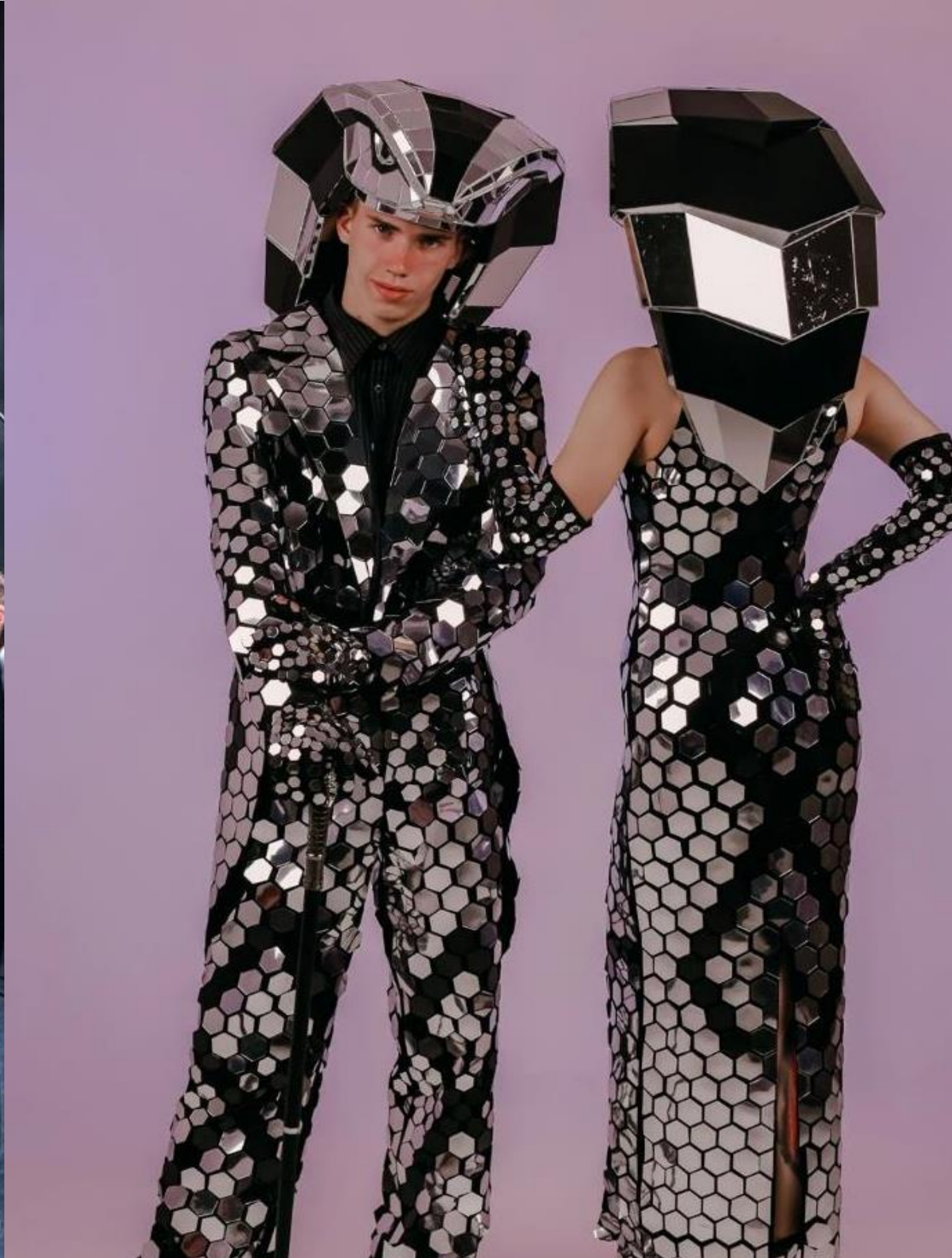
Стильные зеркальные кобры для ваших фото